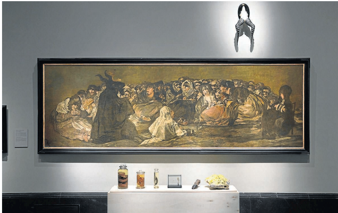
Frente al cuadro 'El aquelarre' hay un altar capaz de invocar al diablo.

Delante ha colocado una especie de altar con una cobra blanquinegra, un sapo común y una salamandra venenosa conservados en etanol, además de una pe-